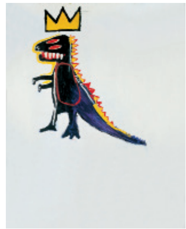
3 Jean-Michel Basquiat Pez Dispenser , 1984 Acrylique et crayon gras sur toile 183 x 122 cm