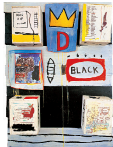
6 Jean-Michel Basquiat Black , 1986 Acrylique, crayon gras, collage de photocopie et de bois sur panneau 127 x 92 x 21,5 cm