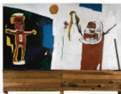
8 Jean-Michel Basquiat Water-Worshipper , 1984 Acrylique, crayon gras, sérigraphie, bois et métal sur panneau 210 x 275 x 10 cm