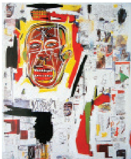
5 Jean-Michel Basquiat King of the Zulus , 1984-1985 Acrylique, crayon gras et collage de photocopie sur toile 208 x 173 cm Collection Musée Cantini, Marseille