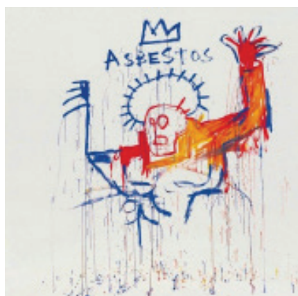
10 Jean-Michel Basquiat Asbestos , 1981-1982 Acrylique sur papier monté sur toile 282 x 272 cm