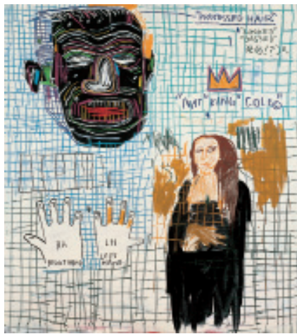
2 Jean-Michel Basquiat Lye , 1983 Acrylique et crayon gras sur toile 167,5 x 152,5 cm