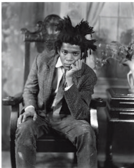
James Van Der Zee Jean-Michel Basquiat, 1982