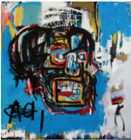
1 Jean-Michel Basquiat Sans titre , 1982 Acrylique sur toile 183,5 x 172,5 cm

Mention obligatoire pour la reproduction de toute œuvre de Jean-Michel Basquiat : © The Estate of Jean-Michel Basquiat/Licensed by Artestar, New York