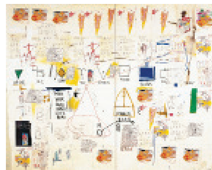
12 Jean-Michel Basquiat Icarus Esso , 1986 Acrylique, crayon gras et collage de photocopie sur papier monté sur bois Diptyque : 228,5 x 285 cm