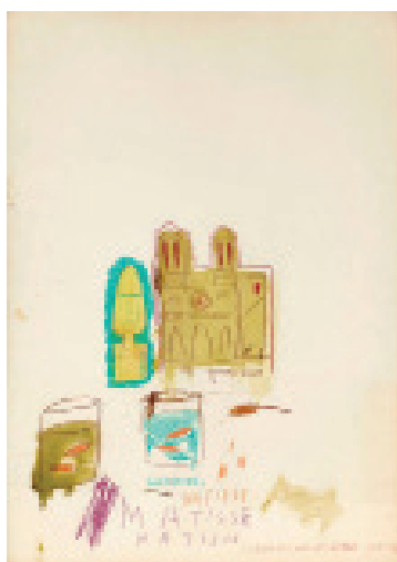
11 Jean-Michel Basquiat Matisse, Matisse, Matisse , 1983 Crayon gras et encre sur papier 70 x 49,5 cm