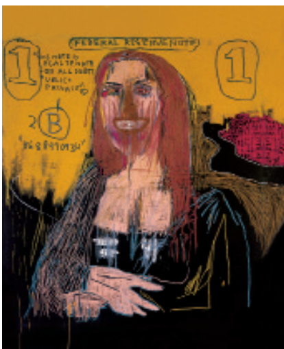
4 Jean-Michel Basquiat Mona Lisa , 1983 Acrylique et crayon gras sur toile 169,5 x 154,5 cm