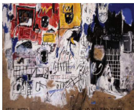
7 Jean-Michel Basquiat Crowns (Peso Neto) , 1981 Acrylique, crayon gras et collage de photocopie sur toile 183 x 239 cm

© The Estate of Jean-Michel Basquiat/Licensed by Artestar, New York